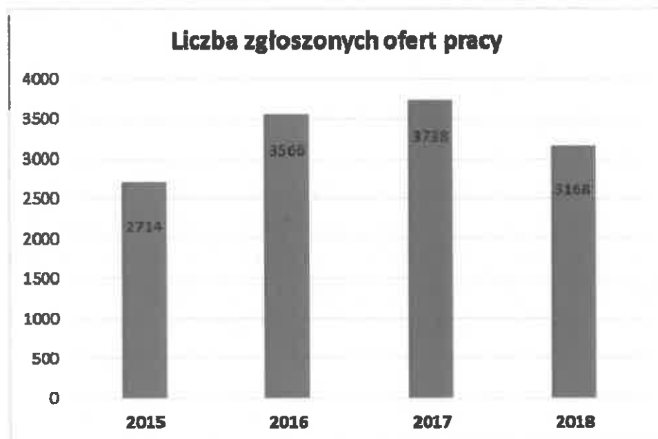
Liczba zgłoszonych ofert pracy.

Poniżej przedstawiono liczbę zgłaszanych ofert pracy w poszczególnych latach.